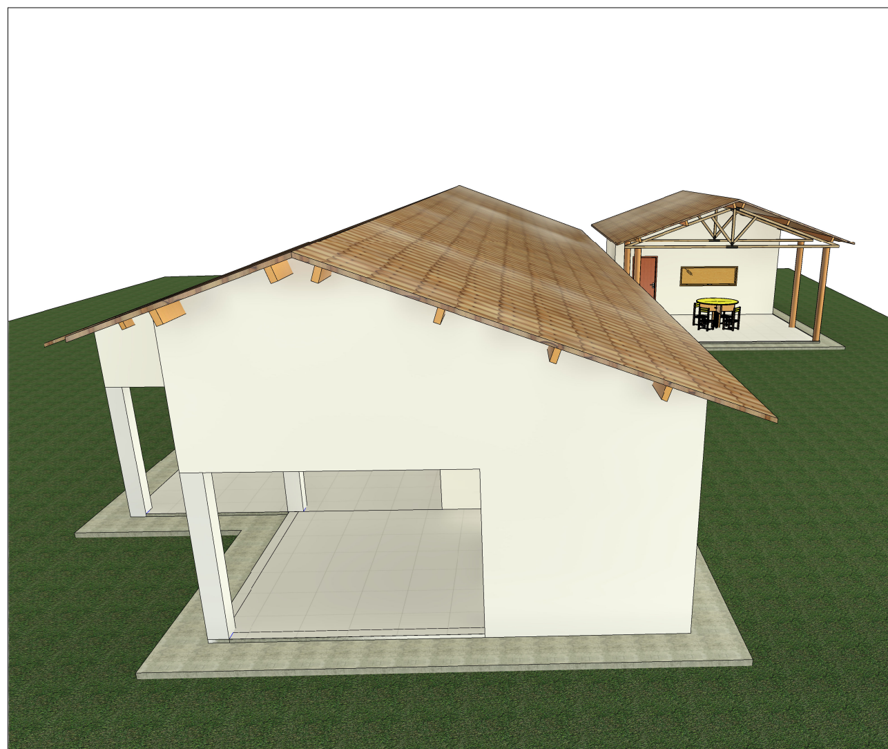
4 Perspectiva 03