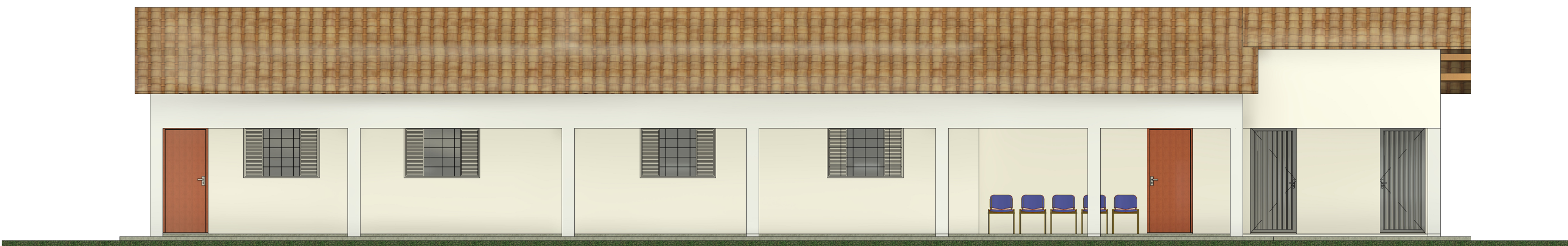
2 Elevação Frontal 1 : 75