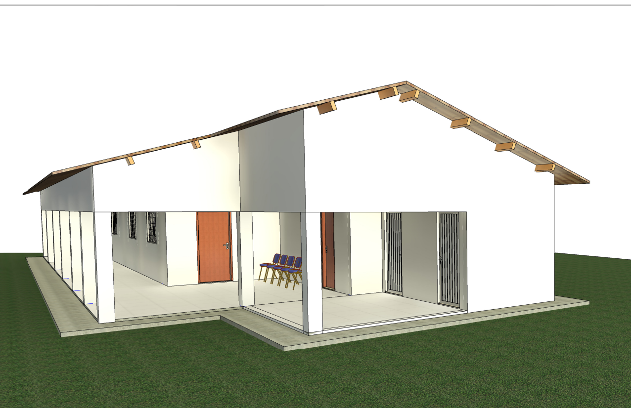
3 Perspectiva 02